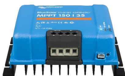
Contrôleur de charge solaire MPPT 150/35