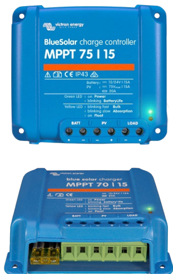
Contrôleur de charge solaire MPPT 75/15